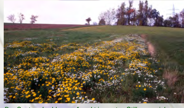
Der Saatwucherblumen-Aspekt im ersten Stilllegungsjahr ...