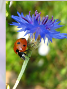
Kornblume mit Marienkäfer