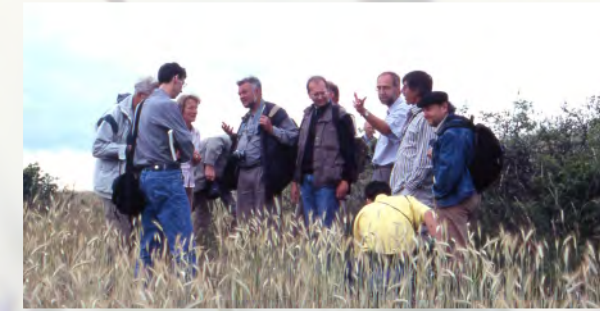
Botanische Exkursion in Karlstadt, 2004