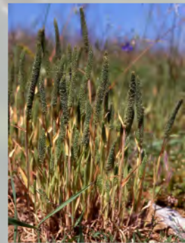
... und Rispen-Lieschgras