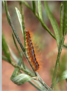
Ringelspinnerraupe auf Kornblume

Über die chemische Unkrautbekämpfung hinaus haben Saatgutreinigung, verbesserte Bodenbearbeitung, früherer Stoppelumbruch und die Veränderung der Standorte durch Aufkalkung, Düngung und Drainage zur drastischen Abnahme der Artenvielfalt auf den Feldern beigetragen.