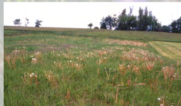
... ist schon im zweiten Jahr einer Grünlandvegetation gewichen (östliches Meißner-Vorland).

Besonders in den Mittelgebirgen, aber auch auf ertragsarmen Sandstandorten des Tieflands wurden vielfach Felder „stillgelegt“: Von Brachfallen oder der Umwandlung in Grünland sind gerade solche Ackerstandorte betroffen, die traditionell extensiv bewirtschaftet wurden und so letzte Rückzugsgebiete bedrohter Arten darstellten. Durch das Ausbleiben der Bodenbearbeitung haben einjährige Arten, die ihren Vegetationszyklus jedes Jahr nach erfolgter Bestellung des Feldes neu durchlaufen, keine Entwicklungsmöglichkeit mehr. Die Ackerwildkräuter werden so bald von ausdauernden Arten verdrängt.