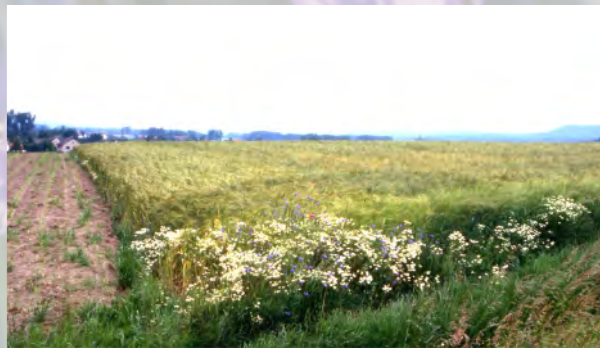
Die Pflanzengesellschaften der Äcker sind heute zu Ackerrandgesellschaften reduziert.

Über die chemische Unkrautbekämpfung hinaus haben Saatgutreinigung, verbesserte Bodenbearbeitung, früherer Stoppelumbruch und die Veränderung der Standorte durch Aufkalkung, Düngung und Drainage zur drastischen Abnahme der Artenvielfalt auf den Feldern beigetragen.