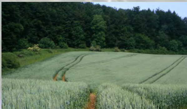
... zum heutigen Normalfall.

... wie Kornblume, Mohn und Kamille waren durch viele Jahrhunderte bunte Begleiter der Nahrungsmittelherstellung auf den Äckern. Etwa drei Viertel aller in Deutschland vorkommenden „Un“-krautarten sind erst mit dem Getreideanbau nach Mitteleuropa eingewandert. Zunehmender wirtschaftlicher Druck auf die Landwirtschaft und daraus resultierende Perfektionierung der Unkrautbekämpfung mit Herbiziden führten in den letzten Jahrzehnten zu einem immer stärkeren Artenschwund im „Lebensraum Acker“; heute steht jede zweite Ackerwildkraut-Art in mindestens einem Bundesland Deutschlands auf der Roten Liste.