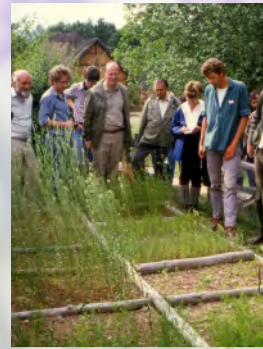
Ackerwildkraut-Beete im Freilichtmuseum Kommern (Eifel), 1984

In der bis November 2008 laufenden Machbarkeitsstudie wird nicht nur bundesweit nach geeigneten Flächen recherchiert. Darüber hinaus wird nach Konzepten und Strategien gesucht, langfristig die Finanzierung und Bewirtschaftung der Schutzäcker sicherzustellen.