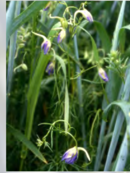
Feld-Rittersporn mit Herbizidschaden

Für viele Tierarten, die direkt oder indirekt auf Ackerwildkräuter als Nahrungsquelle angewiesen sind, bietet die „Nektarwüste Getreidefeld“ keinen Lebensraum mehr. Entsprechend stark ist die Tierwelt der Äcker zurückgegangen.