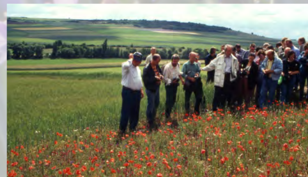
Exkursion der Arbeitsgemeinschaft „Naturschutz in der Agrarlandschaft“ in Rheinland-Pfalz, 1997

Hier sind individuelle Lösungen und die Unterstützung von Sponsoren vor Ort gefragt, aber auch das Engagement von Behörden der Länder, regionalen Ämtern und Vereinen. In der auf die Vorstudie folgend angestrebten Projektphase soll die Umsetzung des Konzeptes erfolgen. Die sachgerechte Auswahl der Flächen, die Optimierung der Bewirtschaftungs- und