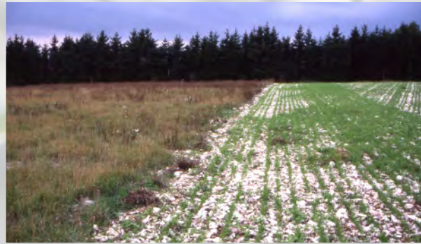
Steinreicher Schutzacker auf der Wernershöhe (Alfeld)