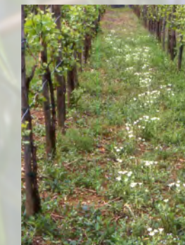
Dolden-Milchstern zwischen Weinreben

die enge Zusammenarbeit mit örtlichen Landwirten ein zentrales Anliegen im Projekt. In dem 2005 veröffentlichten Karlstadter Positionspapier zum Schutz der Ackerwildkräuter wird auf Grundlage der aktuellen Problematik die Forderung nach neuen, nachhaltigen Schutzkonzepten aufgestellt.