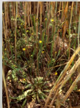
Lämmersalat, eine selten gewordene Art saurer Sandäcker

Pflegemaßnahmen und die Motivierung und Begeisterung der Landwirte werden im Mittelpunkt stehen.