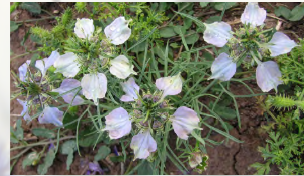
Acker-Schwarzkümmel und Acker-Haftdolde

Hier werden Informationen zum Aufbau des Netzwerks für Ackerwildkräuter bereitgestellt und laufend aktualisiert. Die Seite dient dem Informationsaustausch und der Vernetzung der Akteure. Das Projekt „100 Äcker für die Vielfalt“ kann nur in