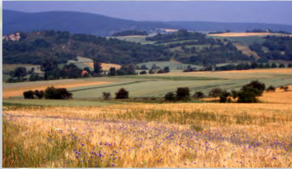
Von der früheren Vielfalt bunter Äcker ...