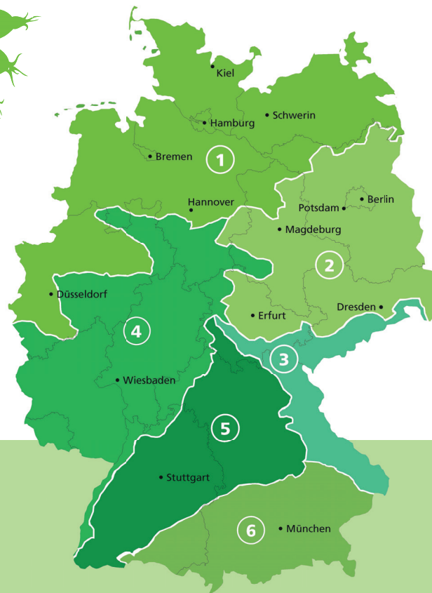
① - ⑥: Vorkommensgebiete gebietseigener Gehölze in Deutschland Karte zu den Ursprungsgebieten von gebietseigenen Gräsern und Kräutern unter https://divergen.lpv.de