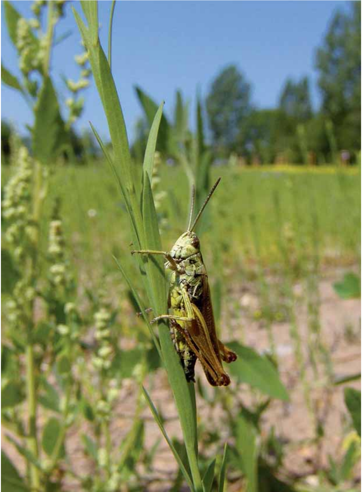
Neue Bewohner an der Fritz-Fritzsche-Straße