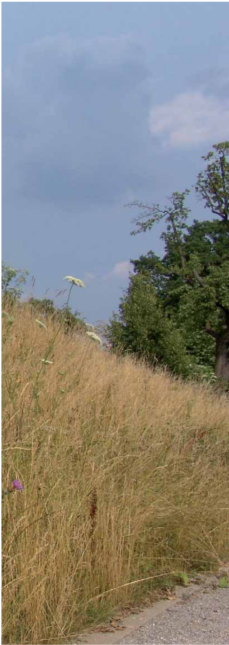
Der neue Lärmschuttdamm im Botanischen Garten, Sommer 2006