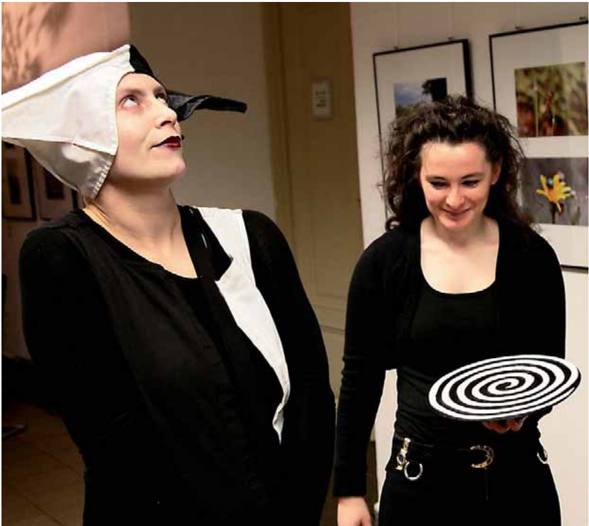
Eröffnung der Wiesenfoto-Ausstellung im Kraftwerk e.V. Januar 2007. Die Balance zwischen Kunst und Natur hält an