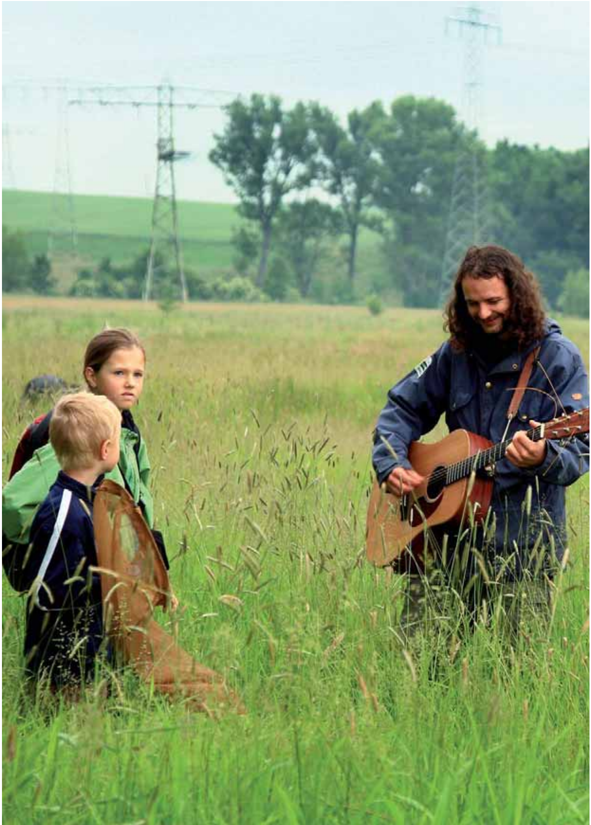
Grillen- und Menschengesang zum Tag der Artenvielfalt