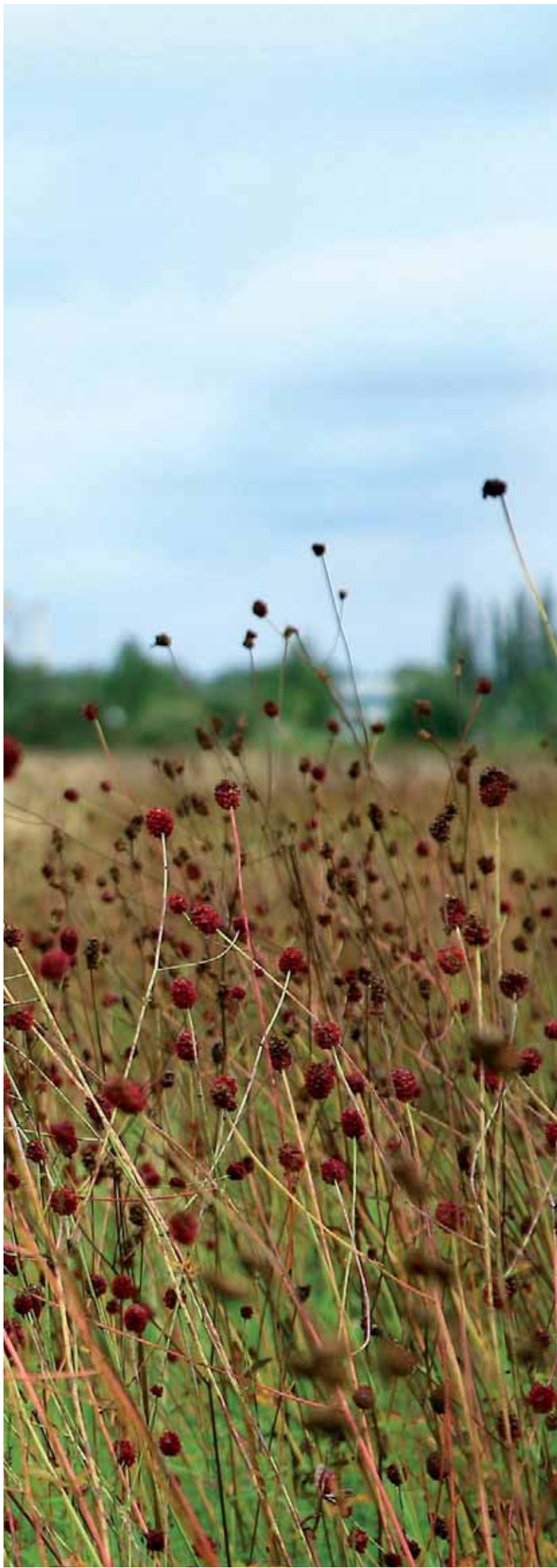
Großer Wiesenknope in dunkelrot auf der Heinersdorfer Sumpfwiese. Von dieser Pflanze lebt neben den Honigbienen auch ein seltener blauer Schmetterling gemeinsam mit einer kleinen gelben Ameisenart, welcher er seinen Nachwuchs anvertraut.