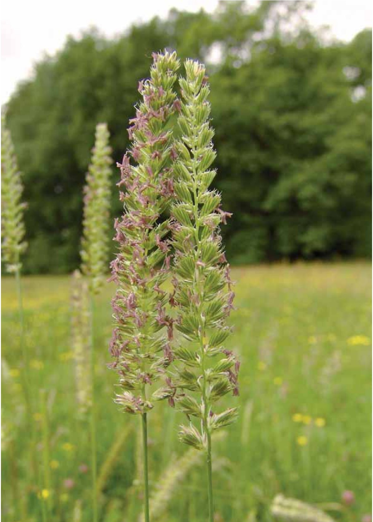
Das Kammgras der Grunewaldwiese ließ sich gut auf die neuen Grünflächen übertragen