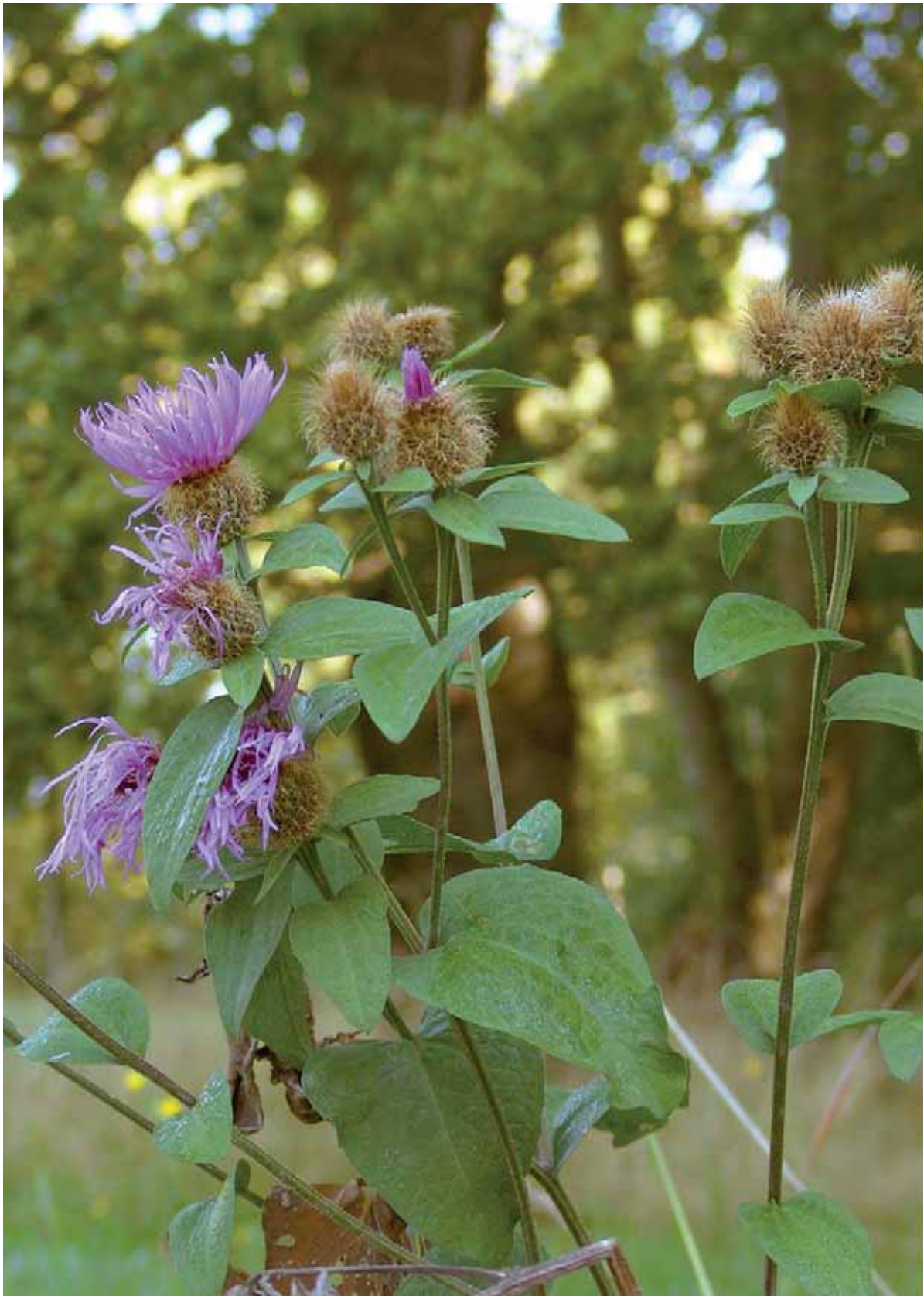
Die Perückenflockenblume aus dem Erzgebirge kommt auch in Chemnitz vor