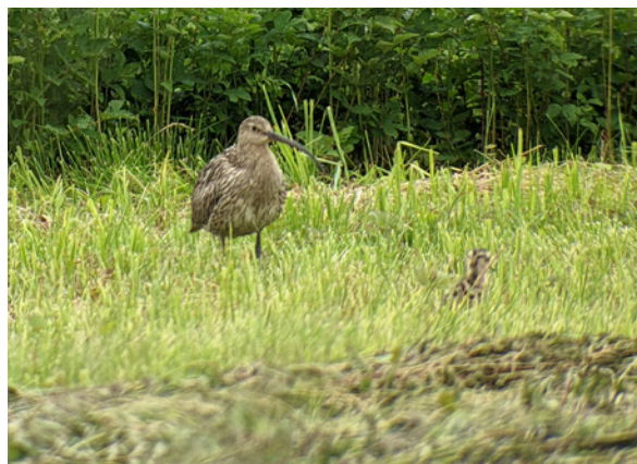
Großer Brachvogel mit Küken an der Zaunanlage Haarmos.

jedoch flächendeckend aufgegeben. Dank der guten Zusammenarbeit mit den Landwirten vor Ort, die beim Auf- und Abbau der Elektrozäune geholfen und diese regelmäßig ausgeschnitten haben, wird die Maßnahme in jedem Fall die nächsten Jahre weitergeführt. Fördergelder kommen vom Freistaat Bayern im Rahmen der staatlichen Landschaftspflege- und Naturparkrichtlinie (LNPR). Um Antragstellung, Organisation und Vernetzung der Akteure kümmert sich der LPV Biosphärenregion Berchtesgadener Land sowie der LBV.