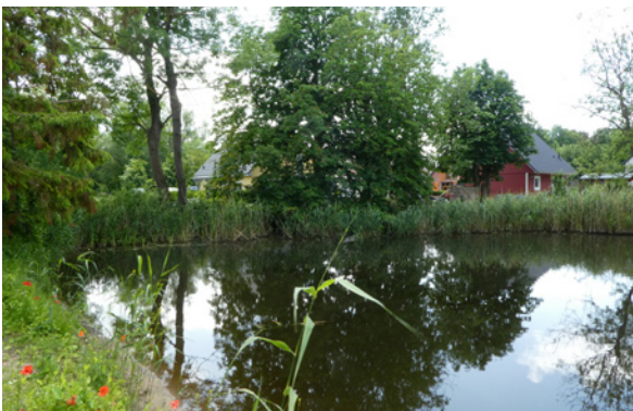
Dorfteich Wiek ein halbes Jahr nach dem Ausbaggern.

Das Teilprojekt InselBiotope des Verbundprojektes „Landschaft + Menschen verbinden – Kommunen für den bundesweiten Biotopverbund“ im Bundesprogramm Biologische Vielfalt macht große Fortschritte bei der Renaturierung von Kleingewässern auf der Insel Rügen. Wie wichtig das Projekt ist, zeigt sich bei einem Blick in die Dorfteiche und Kleingewässer nach diesem außerordentlich trockenen Sommer – so niedrig waren die Wasserstände selten und die Verlandungsprozesse werden dadurch stark beschleunigt. So können diese Biotope nur noch schwerlich ihrer Funktion als Lebensräume und Trittsteine im Biotopverbund für die vorkommenden, zum Teil stark bedrohten Arten erfüllen.