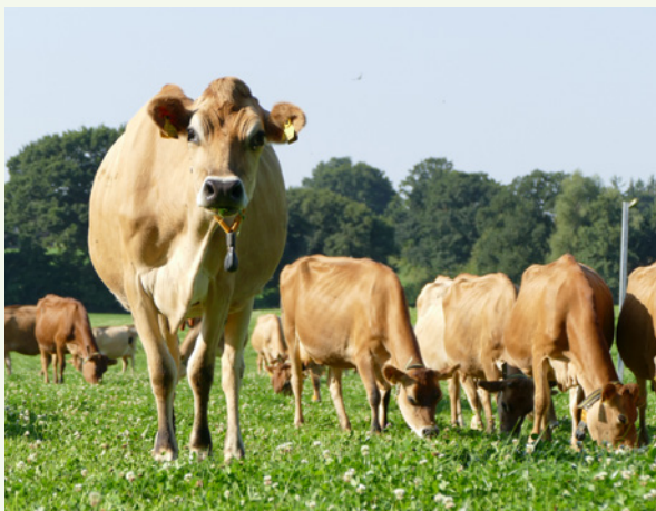
Jerseykühe auf dem Lindhof.