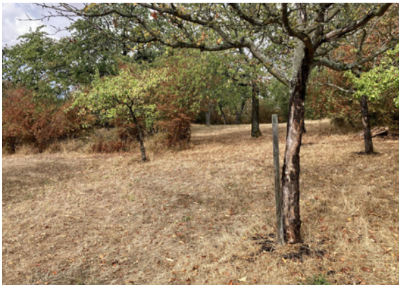
Aufgrund der Trockenheit breiten sich auf Streuobstwiesen zunehmend Krankheiten und Schädlinge wie Rindenbrand und Borkenkäfer aus und führen zum Absterben der Bäume.

die Erhaltung und Verbesserung von Lebensräumen oder den Erhalt seltener Tier- und Pflanzenarten geht. Alle Projekte, ob „Main.Kinzig.Blüht.Netz“, das Schafbeweidungs-Projekt Bergwinkelgrün, das „Wildbienen-Aktion-Netzwerk“ oder auch die zahlreichen Streuobstwiesenprojekte des LPV, sie alle leiden unter den aktuellen Klimabedingungen. Es vertrocknen großflächig ganze Landschaftsbestandteile wie Wälder, Streuobstwiesen und artenreiche Grünlandstandorte, die sich teilweise nur sehr langsam oder gar nicht mehr regenerieren werden.