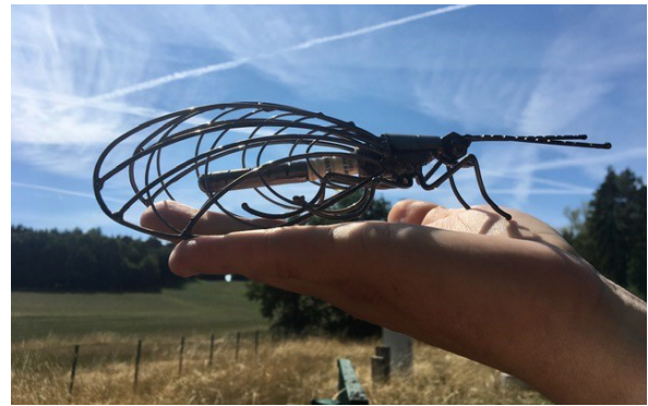
Die Florfliege der Initiative NATÜRLICH BAYERN steht für besonders insektenfreundliches Engagement.

Mehr Informationen zur Auszeichnung unter www.natuerlichbayern.de > Die Initiative > Auszeichnung Insektenfreundliche Kommune