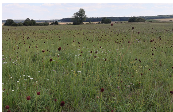
Trotz anhaltender Trockenheit zeigen die Wiesen zum Teil noch eine schöne Blütenpracht, wie hier mit dem Großen Wiesenknopf.