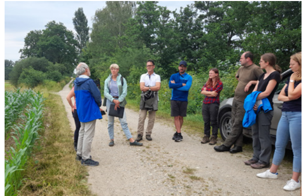
Feldrundgang an der PIK-Fläche im Landkreis Deggendorf.

Eine Neuerung im Projekt stellt die Maßnahme mit verspäteter Maisansaat ab dem 20. Mai dar. Circa 10 ha wurden dieses Jahr mit der verspäteten Maisansaat bewirtschaftet, die vor allem gewährleisten soll, dass die Brut- und Schlupfzeit der Vögel (insbesondere der Kiebitz) bei der späten Ansaat bereits abgeschlossen ist und kein Nest oder Jungvogel zu Schaden kommt.