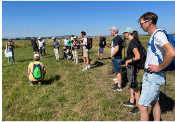
Naturspaziergang über die verschiedenen Grünlandtypen im Mähried bei Staden.

Diese ist Teil der Landesförderung durch das HMUKLV im Rahmen der Richtlinie zur Förderung von Landschaftspflegeverbänden. Bewilligungsstelle ist das Regierungspräsidium Darmstadt. Die Förderung trägt insbesondere zur Umsetzung der Ziele der Hessischen Biodiversitätsstrategie bei.