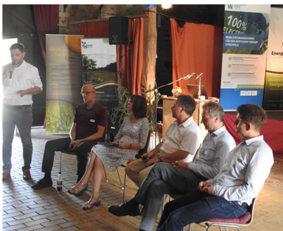
Diskussionsrunde des Brandenburger Energieholztages.

Am 25. August 2022 fand bereits zum 18. Mal der Brandenburger Energieholztag in der Feldscheune