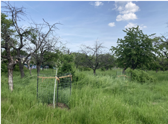
Beweidungsschutz an Neupflanzungen auf der Streuobstwiese auf der Schwedenschanze.

Vor fünfzehn Monaten startete der LPV Mittelthüringen gemeinsam mit der GRÜNEN LIGA Thüringen in das Kooperationsprojekt „Mit Strukturvielfalt zur Insektenvielfalt“. Bis Ende 2023 sollen 688 Streuobstbäume durch Pflege erhalten, 932 hochstämmige Obstgehölze neu angepflanzt und der Unterwuchs entbuscht werden. Mit den Eigentümerinnen und Eigentümern wird eine Pflegebindung auf 15 Jahre vertraglich vereinbart.