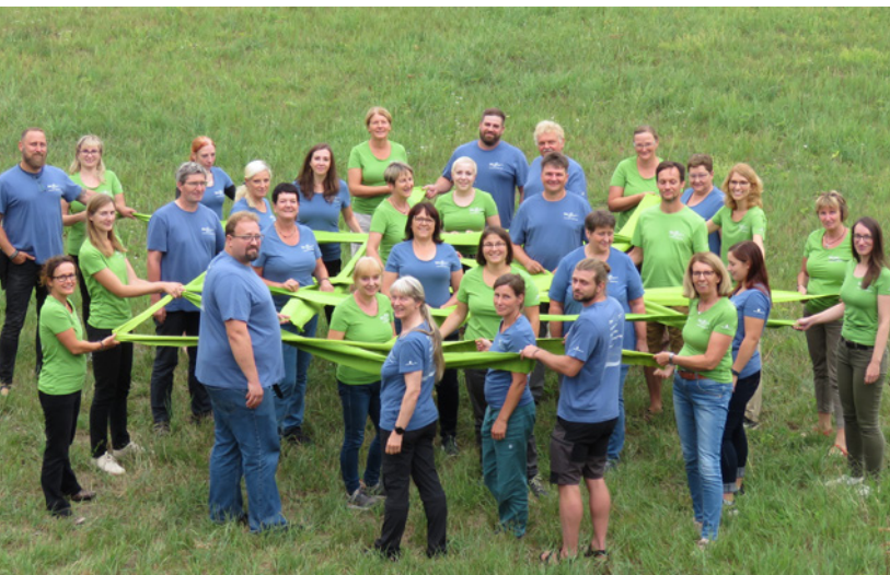
DVL-Netzwerk in Sachsen sichtbar gemacht.