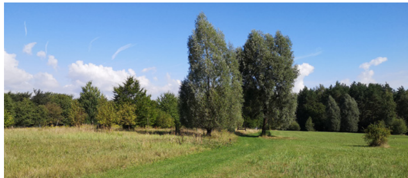
Durch Sanierungs- und Pflegemaßnahmen hat sich die ehemalige Altdeponie in eine halboffene Graslandschaft entwickelt.

Innerhalb des Projektes werden auch Maßnahmen unter Betreuung des LPV exemplarisch erprobt. Dazu zählt die über 6 ha große Altdeponie in Hartau. Die brachliegende Fläche wird durch Gehölzbeseitigung, Mahd und Beweidung mit Galloways saniert und in Nutzung genommen. Hierfür wurde ein naturschutzfachliches Bewirtschaftungskonzept für einen 3,6 ha großen Bereich, der sich im Eigentum der Stadt Zittau befindet, erarbeitet. Dies geschah in enger Absprache mit der Unteren Bodenschutzbehörde, der Landesdirektion Sachsen, der Stadt Zittau, dem Ortschaftsrat der Gemeinde Hartau sowie einem Landwirtschaftsbetrieb. Seit April 2022 hat sich die ehemals stark verbuschte und verfilzte Altdeponie in eine halboffene besonnte Graslandschaft mit einzelnen Bäumen und Strauchgruppen verwandelt, auf der sich die zahlreichen Spaziergänger an bunten Schmetterlingen, zirpenden Heuschrecken und dem Anblick der kleinen Zottelrinder erfreuen.