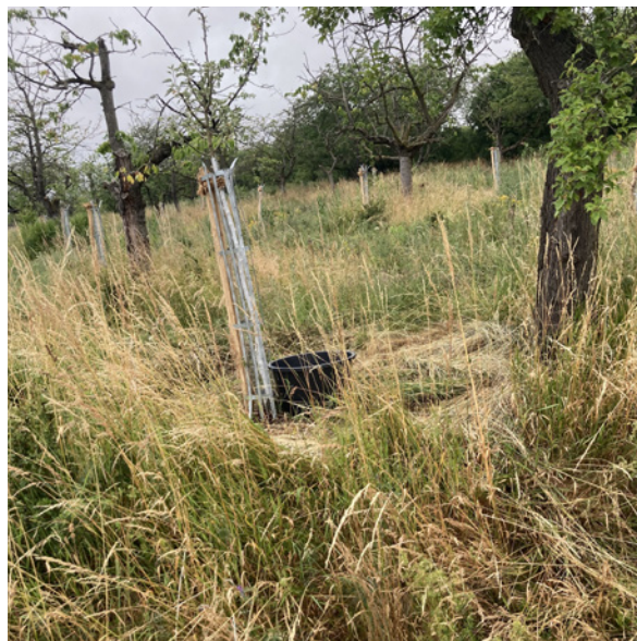
Bewässerung mit perforiertem Behälter auf Baumscheibe.