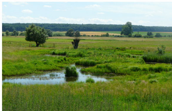
Vielfältige Grünlandgesellschaften wechseln sich kleinräumig ab.