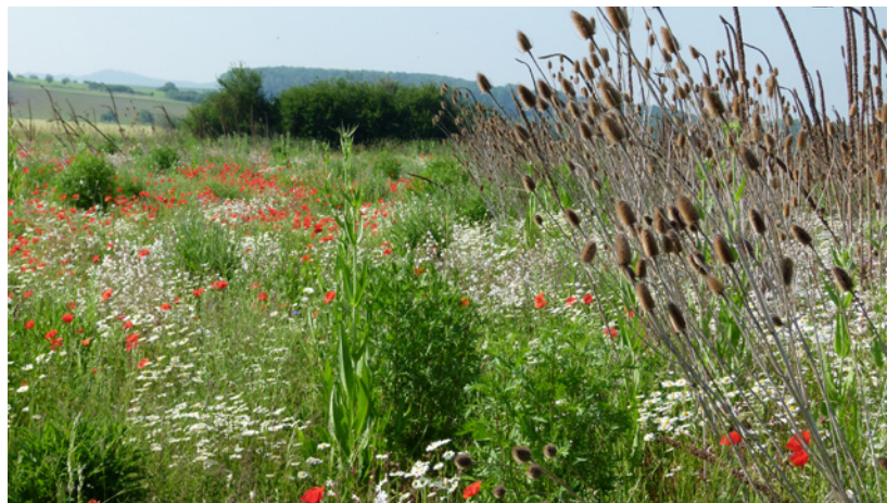
Die Brache – ein vielfältiger Lebensraum für Flora und Fauna.

Da Landwirte oft eine Ansaat vorziehen, um das Auflaufen von Beikräutern zu unterdrücken, wird nur wenig Effekt erwartet, wenn beide Optionen alternativ angeboten würden. Als Kompromisslösung könnten Landwirte den Aufwand für die Beseitigung einer Verunkrautung damit reduzieren, dass sie die selbstbegrünenden Brachen mehrere Jahre auf der gleichen Fläche belassen. Der Bekämpfungsaufwand ist nach mehreren Jahren nicht unbedingt höher als nach einem Jahr.