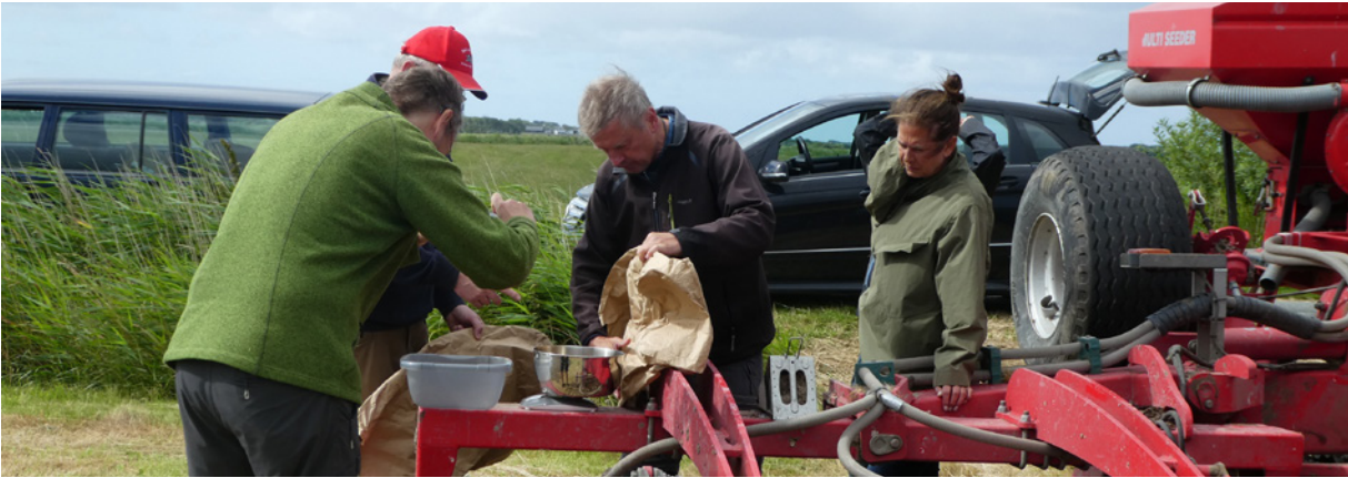
Einstellen der Saatgutmenge bei den Filmaufnahmen.

Welche Konzepte zur Wiederherstellung artenreichen Grünlandes in der Kulturlandschaft erfolgreich sind, wird im dreijährigen Projekt Grassworks untersucht. Der DVL als Praxispartner kann dabei auf die vielfältigen Erfahrungen seiner Landschaftspflegeorganisationen zurückgreifen, die in Anleitungen, Steckbriefe und Videoclips praktischer Maßnahmen eingehen.