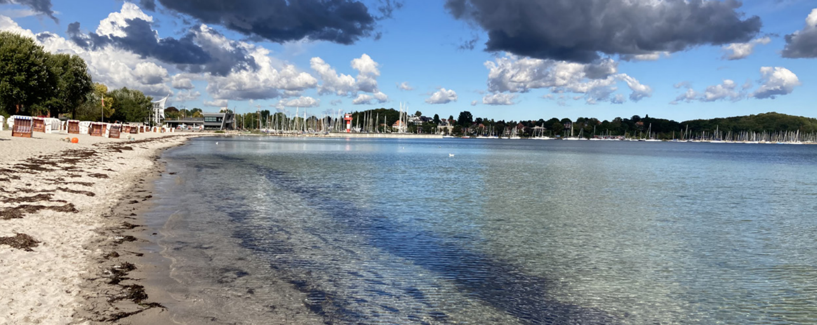
Kulisse des Deutschen Landschaftspflegetages 2022 in Eckernförde an der Ostsee.