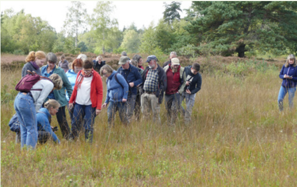
Engagierte Exkursionsteilnehmer in einer Moorheide.

Nährstoffarme Lebensräume, sowohl auf trockenen wie auf feuchten und nassen Standorten, waren bis in die 2. Hälfte des vergangenen Jahrhunderts besonders in der Westhälfte Schleswig-Holsteins weit verbreitet. Besonders ausgedehnt waren sie im Naturraum der Vorgeest, einer fast völlig ebenen Landschaft, die durch Auswaschungsvorgänge am Ende der Weichseleiszeit entstand. Hier reichte das Spektrum der ehemals ausgedehnten naturnahen Lebensräume von teilweise vegetationsfreien Binnendünen über Heiden und Trockenrasen zu Moorheiden sowie Hoch- und Übergangsmooren. Heute sind alle naturnahen nährstoffarmen Lebensräume bis auf die Bereiche, die standörtlich für eine Bewirtschaftung besonders ungünstig waren, verschwunden. Die Vorgeest ist zu einer landwirtschaftlich intensiv genutzten Region mit überwiegend Milcherzeugung geworden, die zusätzlich eine große Dichte an Biogasanlagen aufweist.