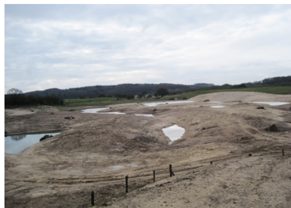
Die Kiesgrube Tinghoe im April 2010...

In der 4 ha großen Kiesgrube Süderschmedeby wurde die Pflege 2007 von einer einmaligen Schafbeweidung im Herbst auf eine effektivere Winterweide mit Robustrindern umgestellt. Auf diesem Gelände kam jüngst ein Bagger zum Einsatz, um Weiden und Erlen zu entfernen und neue Offenbodenstellen zu schaffen. Schon wenige Zeit später ließ sich hier wieder ein Flußregenpfeifer-Pärchen beobachten.