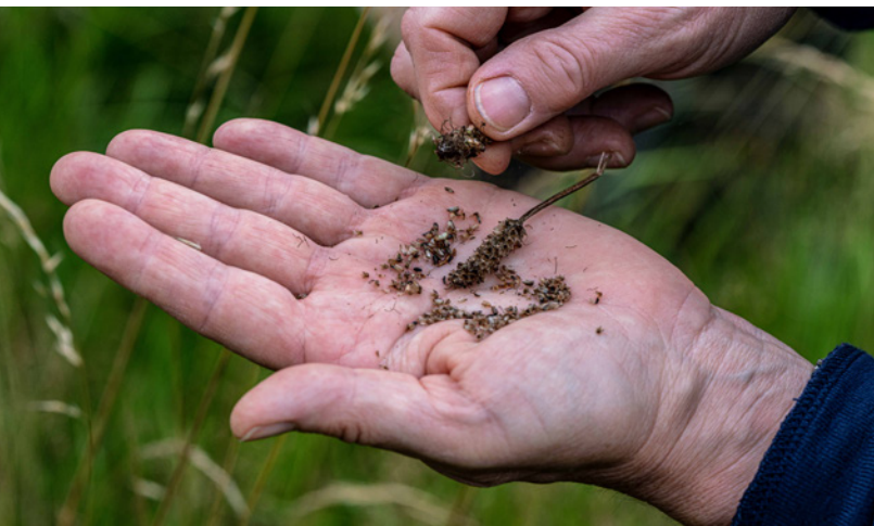
Richtiger Erntezeitpunkt: Fruchtstand des Spitzwegerichs ( Plantago lanceolata ) mit reifen Samen.

insgesamt fünf Veranstaltungen, bestehend aus Theorie und Praxis, konnten sich die Teilnehmenden zur Vorbereitung und dem Vorgehen bei der Saatgutsammlung informieren, bei Bestimmungsübungen ihre botanischen Kenntnisse auffrischen und die Aufbereitung und Reinigung von kleinen Saatgutmengen üben. Insgesamt 15 Personen, darunter Mitarbeitende der sächsischen Landschaftspflegeverbände, ehrenamtliche Naturschützerinnen und -schützer sowie sächsische Regiosaatgutanbauer nahmen an dem Qualifizierungsprogramm teil. Insbesondere für botanisch versierte Akteure aus dem Bereich Naturschutz kann die Sammlung von Ausgangssaatgut eine interessante Nebenaktivität sein, vor allem, wenn sie ohnehin regelmäßig auf artenreichen Grünlandflächen unterwegs sind.