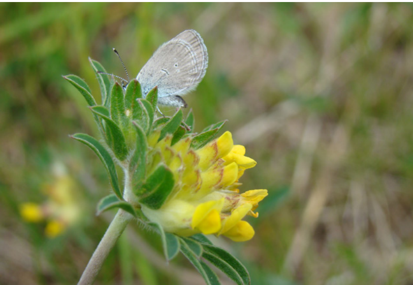
Zwerg-Bläuling an Wundklee.

Mehrere flache Kleingewässer sind neu angelegt worden, vorhandene wurden vergrößert und Steilhänge als potenzielles Bruthabitat etwa für Uferschwalben abgezogen.