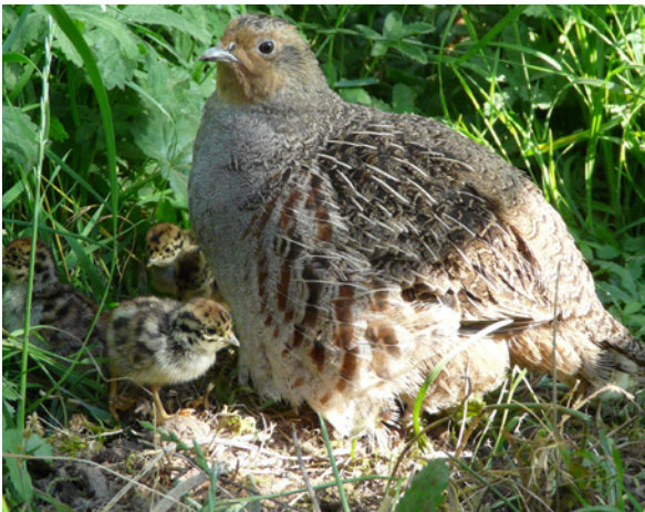
Rebhenne mit Küken.

Durch die Aussetzung der Stilllegung 2023 entstehen dringend benötigte Brachen erst 2024, und damit verschiebt sich die Möglichkeit der Trendumkehr weiter in die Zukunft.