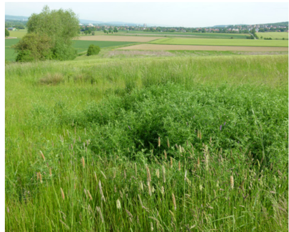
Eine mehrjährige Brache bietet optimalen Lebensraum für das Rebhuhn.

Überwinterung). Daher ist es wichtig, bei der Verpflichtung zur landwirtschaftlichen Mindesttätigkeit eine mehrjährige Bewirtschaftungsruhe für die GLÖZ-Brachen (bis zu 5 Jahre) zu ermöglichen. Bislang hat bereits die einmalige Aussetzung der Mindestnutzung eine Ausnahmegenehmigung erfordert und wurde deshalb von den Landwirten kaum realisiert. Eine mehrjährige Bewirtschaftungsruhe sollte künftig standardmäßig möglich sein.