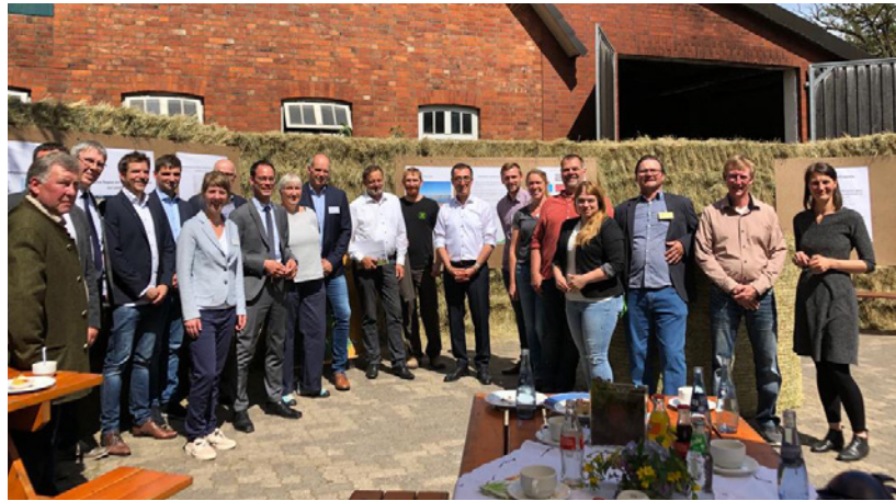
Cem Özdemir und Teilnehmende am Dialog zum Thema Moor- und Klimaschutz im Teufelsmoor.

Aufgabe sei, die es gemeinschaftlich zu lösen gilt und verwies darauf, dass hierfür auch eine Zusammenarbeit der Landwirtschafts-, Umwelt und Wirtschaftsministerien notwendig sei. Die Landwirtschaft in der Teufelsmoor-Region sei bei ausreichender Förderung bereit für neue Wege und könnte als gutes Beispiel für andere moorreiche Regionen Deutschlands vorangehen.