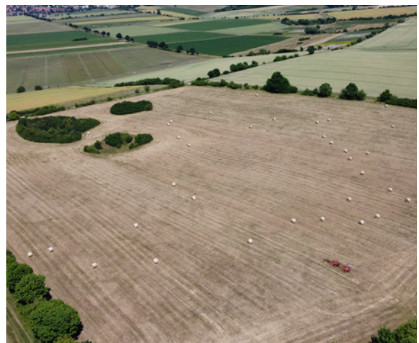
Schutzinsel aus lockeren Gehölzen.

Mehr Informationen zum Projekt finden Sie unter www.rebhuhn-retten.de .