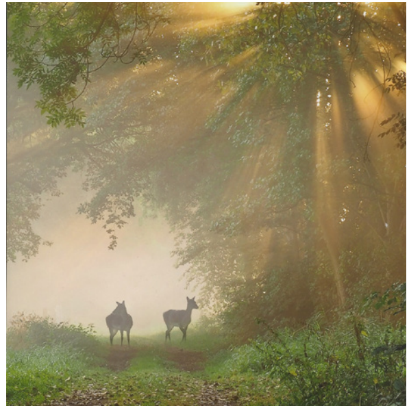
„Rehe im Nebel“ ist der Titel des Siegerfotos des Fotowettbewerbs NATUR DER LAUSITZ.

Hierfür bitte Klaus Schwarz vom LPV per E-Mail – Klaus.Schwarz@abnachdraussen.net – kontaktieren.