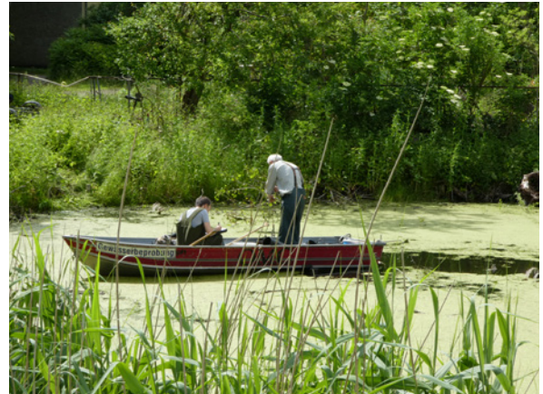
Gewässerbeprobung in Trent zur Ermittlung der Schlamm-tiefe.

Gewässers wiederhergestellt, sodass es sich wieder selbst regulieren kann. Danach wird das DRAUSY-System in einem anderen Kleingewässer auf Rügen eingesetzt.