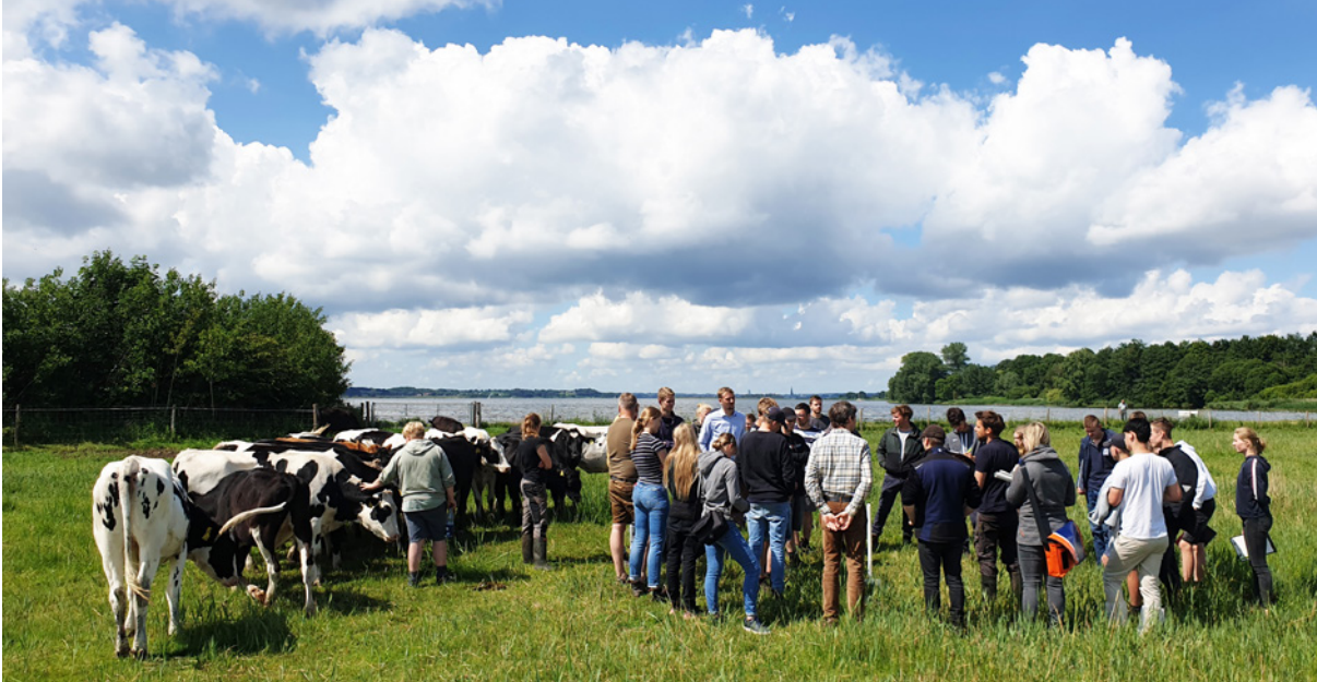
Besprechung mit den landwirtschaftlichen Berufsschüler und -schülerinnen zur Bedeutung einer gezielten Beweidung für die Entwicklung wertvoller Salzwiesen-Lebensräume an der Schlei.

im nächsten Jahr wird das Umweltbildungsprojekt mit dem nächsten Ausbildungsjahrgang am Berufsbildungszentrum Schleswig über den Naturpark Schlei durchgeführt.