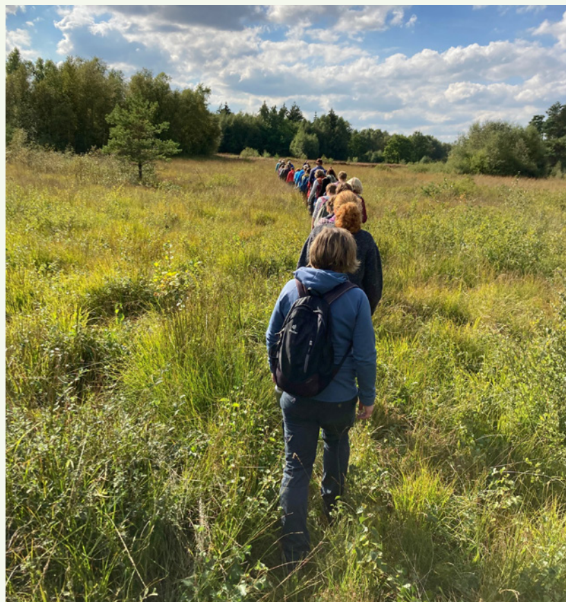
Karawane durchs Hochmoor.