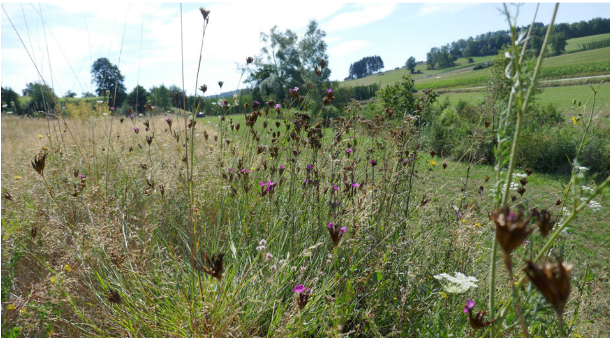
In den trockenen Kernbereichen ist das Ziel, eine vielfältige Kulturlandschaft mit extensiv genutzten Wiesen, buntblühenden Böschungen und Hecken zu erhalten.