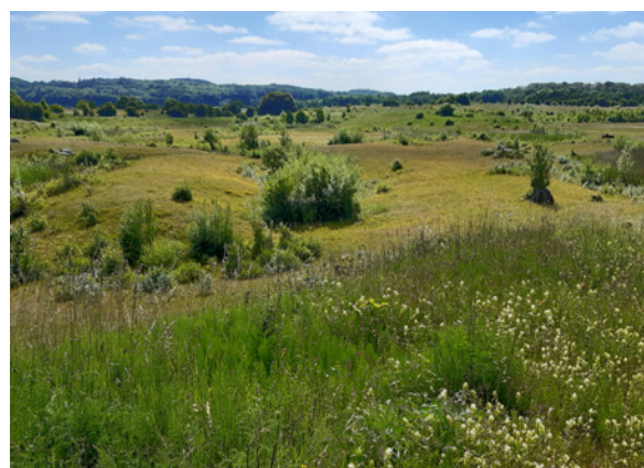
... und im Juni 2022.

Kontakt: Britta Gottburg und Elise Dierking, Naturschutzverein Obere Treenelandschaft e. V., Tel. 04630 936096, gottburg@oberetreenelandschaft.de