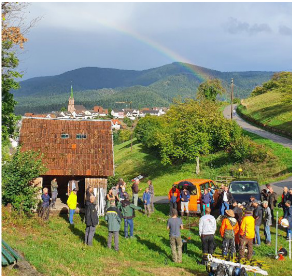
Viel Interesse beim Zaunbauseminar des Landschaftserhaltungsverbands Landkreis Rastatt.

Die 11 Praxisveranstaltungen beleuchteten unterschiedliche Aspekte des Herdenschutzes. Die Teilnehmenden erhielten beispielsweise Empfehlungen zum Zaunbau, informierten sich zu Zäunung in schwierigem Gelände, Zaunpflege und Zaunmonitoringsysteme. Auch ein Erfahrungsaustausch zur Haltung von Herdenschutzhunden fand statt, und Herdenschutzberater gaben Informationen zu Fördermöglichkeiten und dem Einsatz von Notfalls-Sets. Insgesamt nahmen rund 140 Weidetierhaltende und Multiplikatoren an den Praxisveranstaltungen teil.