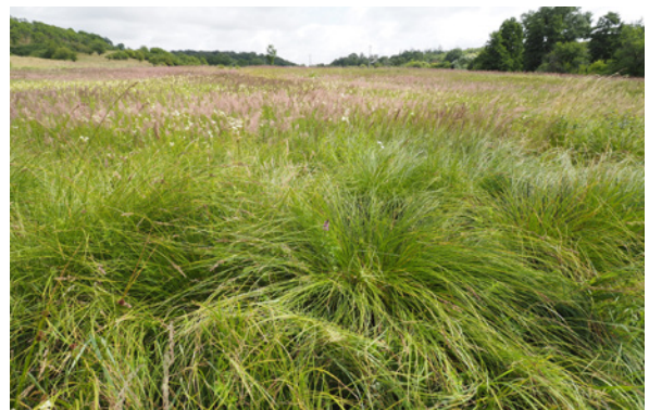
Kalkreiche Niedermoore.

Nachdem in Mecklenburg-Vorpommern für die Gebiete von gemeinschaftlicher Bedeutung Managementpläne aufgestellt wurden, soll nun die zielgerichtete Umsetzung der Maßnahmen erfolgen. Dabei hängt der Erfolg der Maßnahmen wesentlich von der Kooperation mit den Flächennutzern und Flächeneigentümern ab.