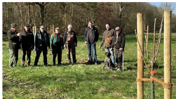
Die fleißigen Helfer auf der neuangelegten Streuobstwiese.

Beispiel für Engagement für die Artenvielfalt. Gemeinsam hoffen alle Beteiligte auf einen guten Anwuchs der Bäume.