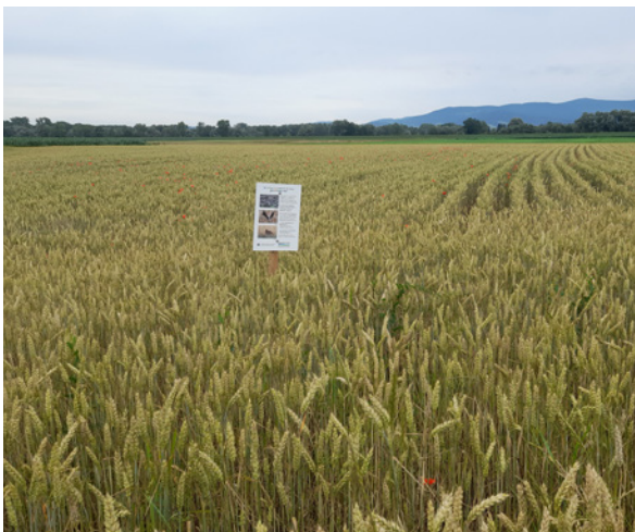
PIK-Maßnahme Getreide in erweiterter Reihe.

Seit der Brutsaison 2015/2016 führen Landwirtinnen und Landwirte aus den Landkreisen Straubing-Bogen und Deggendorf als Kompensation für den Bau von Hochwasserschutzmaßnahmen produktionsintegrierte Kompensationsmaßnahmen (PIK-Maßnahmen) zum Schutz von Wiesenbrütern auf ihren Flächen durch. Zu verdanken ist das dem Projekt einer Arbeitsgemeinschaft von DVL, dem Landschaftspflegeverband Straubing-Bogen und dem Planungsbüro Bosch&Partner. Auftraggeber für diese Ausgleichsmaßnahme ist die Wasserbauische Infrastrukturgesellschaft mbH (WIGES). Die aktuelle Projektphase vom Frühjahr 2020 bis Ende 2024 läuft unter der Leitung der Deutsche Landschaften GmbH. Im Rahmen des Projekts werden vor allem