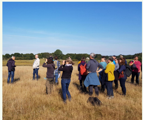
Die Holmer-See-Niederung, ein bedeutsamer Schwerpunkt-raum für den Gefäßpflanzenschutz in Schleswig-Holstein.

wurde ein Vorzeigeprojekt für den Klima- und Biotopschutz an der Schlei vorgestellt. In einer 23 ha großen, verwallten Senke wurden die Flächen gesichert und das inzwischen marode Schöpfwerk abgestellt. Innerhalb kurzer Zeit bildete sich eine ca. 9 ha große Wasserfläche, die sofort von Wasservögeln und Limikolen angenommen wurde. Während der Exkursion zeigten sich unter anderem Kraniche und eine Wasserralle. Der für 2023 geplante Bau von Durchstichen zur Schlei soll bewirken, dass eine naturnahe Brackwasserdynamik wiederhergestellt wird, während zeitgleich die eingeleiteten Nährstoffe zurückgehalten werden. Auf dem 5 km entfernten Hof Schoolbek wurden neben Schutzäckern für Ackerwildkräuter (es kommt u. a. der Lammersalat vor) und Magerwiesen auch das Gebiet um den Holmer See vorgestellt. Hier bereitet die Lokale Aktion aktuell ein Projekt vor, um das letzte Vorkommen des Sumpf-Läusekrauts im Gebiet zu erhalten. Zum Abschluss wurde ein Beweidungsprojekt besucht, welches ca. 8 ha inzwischen verbrachte Feucht- und Salzwiesen wieder unter Beweidung nimmt und so versucht, eine artenreiche, angepasste Pflanzenvielfalt wiederherzustellen. Unter Beobachtung einer kleinen Herde Charolais-Rinder konnten auf benachbarten Flächen spezielle Salzpflanzen wie die Salz-Bunge und die Bodden-Binse gefunden werden.