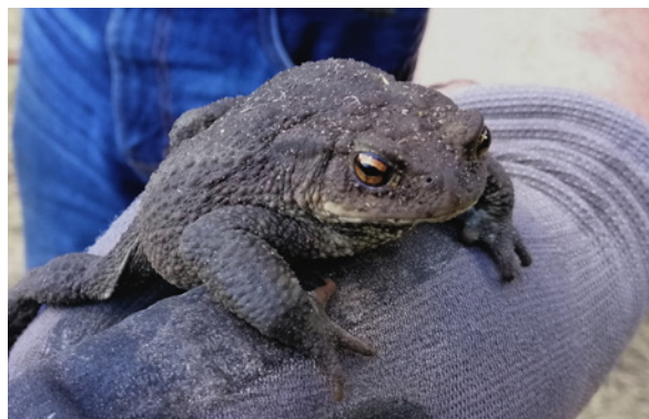
Bei den Bauarbeiten gefundene Erdkröte – sie wurde wohlbehalten in die neue Benjeshecke umgesetzt.

Klein Kubbelkow, Schwarbe und Jarkvitz im Herbst 2021 ausgebaggert wurden, findet man dort nun bereits blühende Biotope voller Leben vor, mit zahlreichen Fröschen, Wasservögeln und Libellen. Die naturnahe Umfeldgestaltung an diesen Gewässern steht noch aus. In den Gemeinden Gingst, Trent und Patzig hingegen sind die Maßnahmen zur Anlage von Gehölzpflanzungen, Flachwasserbereichen, Blühflächen und Streuobstwiesen bereits in vollem Gange. Seit August 2022 wird hier das Gewässerumfeld umgestaltet, um ein hochwertiges Mosaik aus Lebensraumelementen zu schaffen und so die Qualität der Landhabitats zu verbessern.