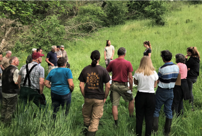
Der LPV Göttingen informiert Grünlandbewirtschaftende.

Im Landkreis Göttingen gibt es noch einige wertvolle, artenreiche Grünlandflächen, die Lebensraum vieler seltener Pflanzen- und Tierarten sind. Zu ihrem Erhalt müssen sie weiter naturschutzgerecht bewirtschaftet werden.