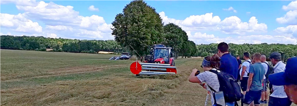
Ein Kammschwader bei der Maschinenvorführung am Nachmittag.

Kontakt: Beate Krettinger, DVL-Koordinierungsstelle Bayern, Tel. 0981 180099-15, b.krettinger@dvl.org