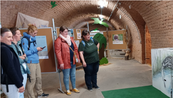
Erfahrungsaustausch zum Anfassen – Besuch der Kolleginnen vom LPV Sächsische Schweiz-Osterzgebirge in der Natura 2000-Ausstellung.

Bereits seit zehn Jahren stellt sich der LPV mit dem Projekt „Netzstelle Natura 2000 – Entdecke Europa vor deiner Haustür“ der Frage, wie es gelingen kann, Naturschutz so zu kommunizieren, dass sich alle Mittragenden einbezogen fühlen. Mit seiner vielfältigen Öffentlichkeitsarbeit im Rahmen des Projektes trägt der LPV dazu bei, dass sich die Menschen vor Ort mit „ihren“ Natura 2000-Gebieten identifizieren und selbst aktiv werden wollen.