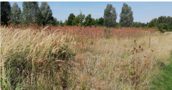
Landreitgras und Wilde Karde überwucherten die ehemalige Deponie Hartau bis April 2022.

„Zentrales Netzwerk Graslandmanagement zur Förderung der Artenvielfalt“ lautet der Titel des Projektes, mit dem sich der LPV Zittauer Gebirge und Vorland seit Januar 2020 bis Dezember 2022 beschäftigt. Finanziert wird das Projekt durch die Richtlinie Natürliches Erbe (RL NE/2014) über den Fördergegenstand C3 (Zusammenarbeit zum Schutz der Biologischen Vielfalt). Mehrere Ziele stehen im Fokus: Im Bereich des Naturparks „Zittauer Gebirge“ wird bislang unbewirtschaftetes Grünland künftig naturschutzfachlich sinnvoll und praktikabel bewirtschaftet. Interessierte Flächeneigentümer werden beraten und dabei unterstützt, neue Bewirtschafter für ihre Grünland zu finden. Außerdem bringt der LPV interessierte Akteure der Landschaftspflege, wie Flächeneigentümer, Landwirte, Kommunen, Naturschützer und Behörden, miteinander ins Gespräch. Auf verschiedenen Veranstaltungen wird Information u.a. zur Grünlandnutzung vermittelt, es wird für die Ansprüche und Zwänge der einzelnen Akteure sensibilisiert und das Bewusstsein für die eigene Kulturlandschaft gestärkt.