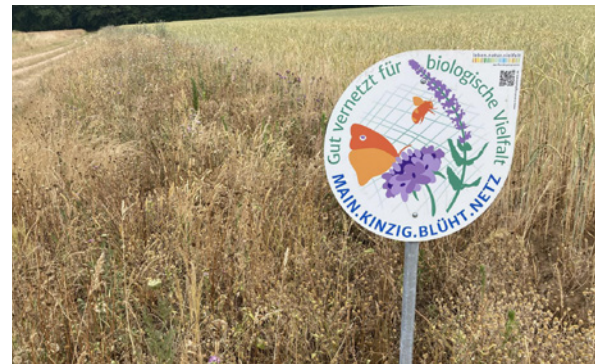
Auch die Blühstreifen im Main.Kinzig.blüht.Netz-Projekt boten in diesem Jahr schon früh einen traurigen Anblick.