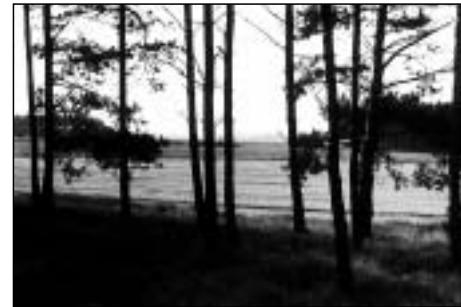
Abb. 3 Offener Waldrand führt zur Verhagerung, bietet keinen Schutz

Auf der Grundlage unterschiedlicher Standortbedingungen, der Baumartenzusammensetzung, der Funktion und der bisherigen Waldbewirtschaftung besteht eine große Mannigfaltigkeit in der Waldrandausbildung. Gleichzeitig werden aber auch die Möglichkeiten und Defizite einer notwendigen funktionsgerechten Waldrandgestaltung offensichtlich. Besonders in den Kiefernwaldgebieten Brandenburgs fehlen ökologisch wertvolle, vielgestaltige Waldränder (siehe Abb. 3 ).