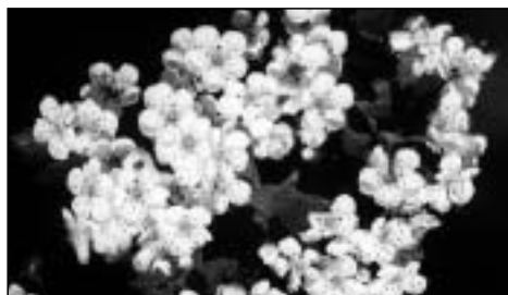
Abb. 6 Zweigriffliger Weißdorn ( Crataegus laevigata )

Vogelkirsche ( Prunus avium ) Winterlinde ( Tilia cordata )