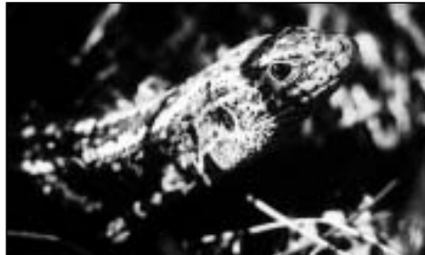
Abb. 2 Zauneidechse ( Lacerta agilis )

■ Reptilien: Ringelnatter, Blindschleiche, Zauneidechse