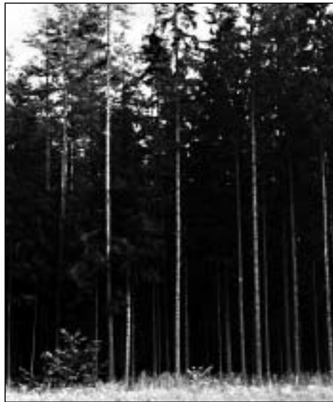
Abb. 4 Derartig offene Forstflächen ermöglichen das Eindringen von Luftschadstoffen und fordern direkt zum Aufbau eines Waldrandes heraus

Pflanzmaßnahmen zur Gestaltung von Waldrändern sollten bei flächenmäßig vorhandenen bzw. sich entwickelnden Sandrohrbeständen nicht erfolgen.