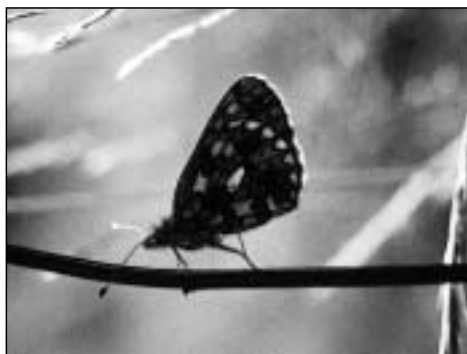
Abb. 1 Perlmuttfalter ( Argynnis adippe )

Waldränder sind Übergangsbereiche von Wald zu angrenzender offener Landschaft. Sie werden geprägt durch mikroklimatische Besonderheiten, vor allem von Temperatur und Feuchtigkeit. Sie weisen in ihren Lichtverhältnissen große Unterschiede auf und sind unter den jeweiligen Bodenverhältnissen ein vielseitiger Lebensraum für die Pflanzen- und Tierwelt. Diese setzt sich vielfältig aus Arten der benachbarten Wald- und Offenlandflächen, aber auch aus speziellen Waldrandarten zusammen. Damit sind Waldränder wertvolle, besonders zu schützende Saumbiotope. Waldränder bieten Schutz, Deckung, Fluchtwege und damit Lebensraum für Niederwild und die Vogelwelt. Durch die linienhafte Ausbildung der Waldrandgesellschaften spielen diese eine wichtige Rolle als Vernetzungselement im Biotopverbund. Das Artenspektrum von Waldrändern ist sehr unterschiedlich und hängt ab von den konkreten Standortbedingungen. Die Artenvielfalt von Waldrändern ist so groß, daß hier nur einzelne, häufig vorkommende Vertreter genannt werden können: