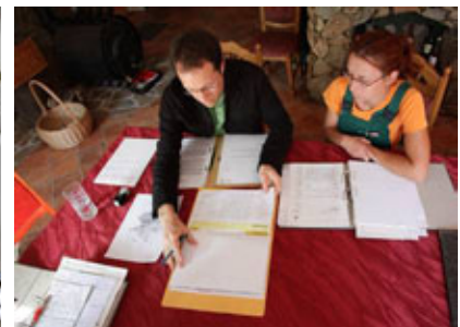
Pflege, Ernte und Kontrolle des regionalen Saatgutes in Sachsen