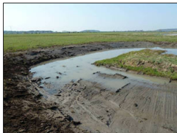
neu angelegter Tümpel in Crawinkel