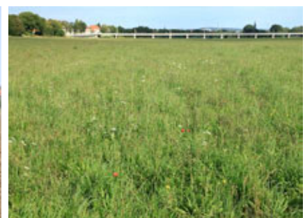
Mischung, Ausbringung und Aufwuchs im ersten Jahr in der Dresdner Elbe-Flutrinne

Bezüglich der Thematik gebietseigene Gehölze erarbeitet der DVL in enger Zusammenarbeit mit den Länderbehörden tragfähige Zertifizierungs- und Umsetzungsmethoden für den Freistaat. Neben §40 Bundesnaturschutzgesetz (BNatSchG) sind dabei auch die organisatorischen und personellen Möglichkeiten der regionalen Baumschulen sowie der Naturschutz- und Forstbehörden zu berücksichtigen. Die Beerntungen von acht ausgewählten Gehölzarten wurden von den Projektpartnern des DVL (2 LPV und eine Naturschutzstation) auch im Spätsommer/Herbst 2011 fortgeführt. Das Erntegut 2010 wurde in der Partnerbaumschule stratifiziert und ausgesät, und im Frühsommer 2011 konnten sich die Beteiligten