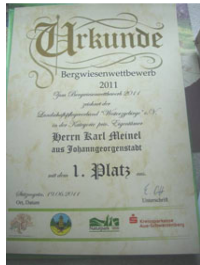
Urkunde für den Sieger zum 10. Bergwiesenfest in Stützengrün

Der LPV Westerzgebirge e.V. war 2002 der „Erfinder“ der Bergwiesenwettbewerbe- und feste, und seit 2003 finden diese in allen Mittelebigsregionen zwischen Vogtland und Zittauer Gebirge statt, auch grenzüberschreitend mit tschechischen Nachbarn im Oberen Vogtland, der Sächsisch- böhmischen Schweiz und im Zittauer Gebirge. So wurden seit 2002 ca. 400 Bergwiesenbewirtschaftler – vom interessierten Privateigentümer bis hin zu Agrargenossenschaften – besucht, ihre Wiesen begutachtet und ihr Engagement für den Naturschutz auf mehr als 50 Bergwiesenfesten gewürdigt. Die Bergwiesenfeste bieten nach wie vor ein gut besuchtes Forum, um die Faszination der Bergwiesen mit allen Sinnen erlebbar zu machen und über Natura 2000, Kulturlandschaften und regionales Wirtschaften zu informieren.