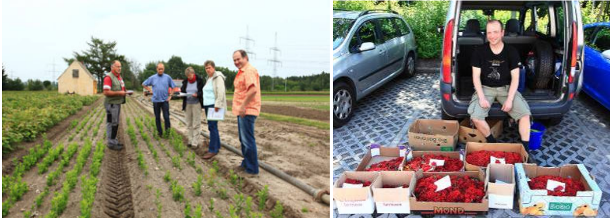
Bestandskontrolle der Ernte 2010 in der Anzuchtbaumschule (links) und neues Sammelgut 2011

vom bisherigen Anzuchterfolg überzeugen. Eine Positivliste für zukünftig in Sachsen relevante gebietseigene Gehölze wurde mit dem BdB-Landesverband Sachsen abgestimmt. In dieser Liste werden insgesamt 18 Gehölz-Sippen außerhalb des Zuständigkeitsbereiches des Forstvermehrungsgutgesetzes (FoVG) als prioritär und wirtschaftlich sinnvoll angesehen. Die nächste Aufgabe wird die möglichst schnelle Kartierung von Erntebeständen für die neun bisher noch nicht im Projekt erfassten Arten sein.