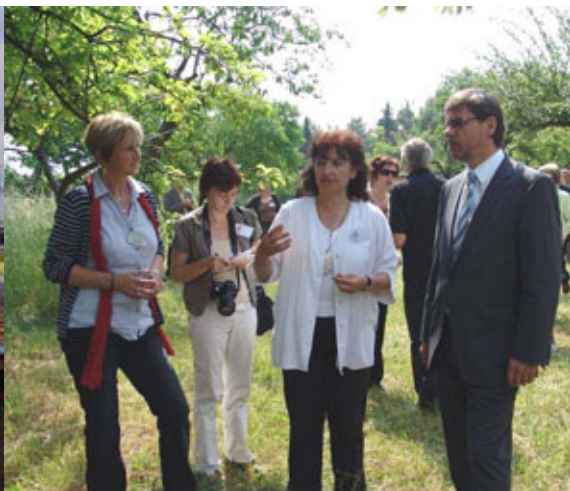
Fachgespräche auf der Streuobstwiese mit Staatsminister Kupfer (im Bild rechts, mit V.Leißner vom LPV Nordwestsachsen und Chr.Kretzschmar vom DVL)