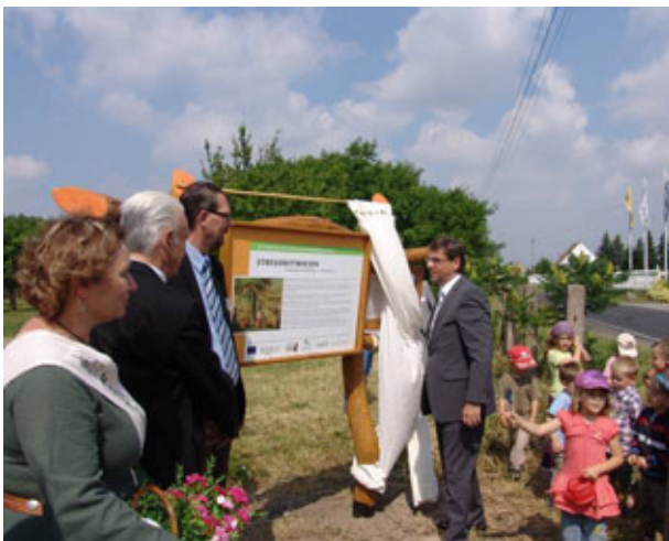
Staatsminister Kupfer mit LPV- Vorsitzenden Tiefensee MdL und Landrat Czupalla beim enttüllen der Informationstafel auf der Demonstrationsstreuobstwiese Eilenburg (Juni 2011)

Auf dem Deutschen Landschaftspflegeetag 2010 in Grimma gab Staatsminister Kupfer offiziell den „Startschuss“ zu der Kampagne, indem er den ersten Zuwendungsbescheid an den LPV Nordwestsachsen e.V. für ein Projekt zur Öffentlichkeitsarbeit zum Streuobst übergab. Im Juni 2011 luden DVL- Landesbüro. und LPV Nordwestsachsen e.V. dann Staatsminister, Landrat, Behörden, Kommunen, Naturschutzverbände sowie Imker und Streuobstinteressierte zur offiziellen Übergabe einer Demonstrations-Streuobstwiese nach Eilenburg ein.